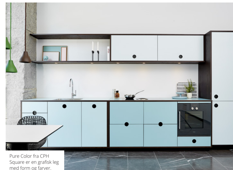
Pure Color fra CPH Square er en grafisk leg med form og farver.