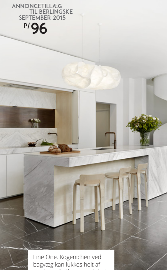
Line One. Kogenichen ved bagvæg kan lukkes helt af med parallellåger. Bordplade og paneler på bagvæg i marmor og bruneret messing.

Boform Infinity med fronter i grå-bejdet ask udført i sildebensmønster - en proces, der kræver stor håndværksmæssig kunnen.