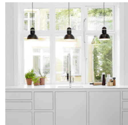
Soft Frame fra CPH Square er en nyfortolkning af det klassiske forrammekøkken.