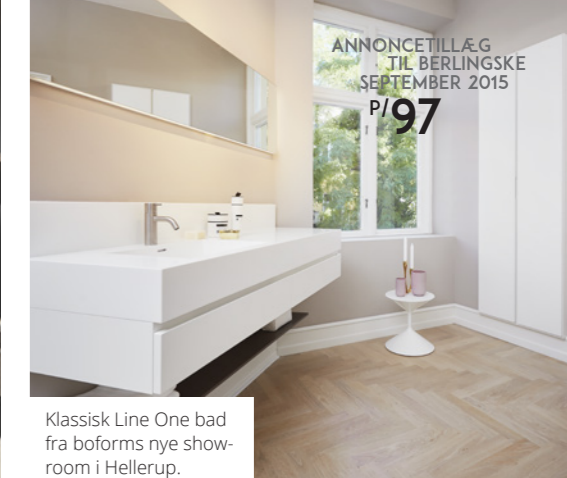
Klassisk Line One bad fra boforms nye showroom i Hellerup.