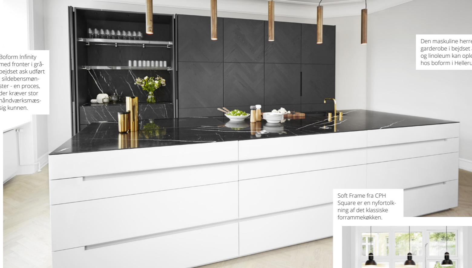
Den maskuline herregarderobe i bejdet ask og linoleum kan opleves hos boform i Hellerup.

Boform Infinity med fronter i grå-bejdet ask udført i sildebensmønster - en proces, der kræver stor håndværksmæssig kunnen.